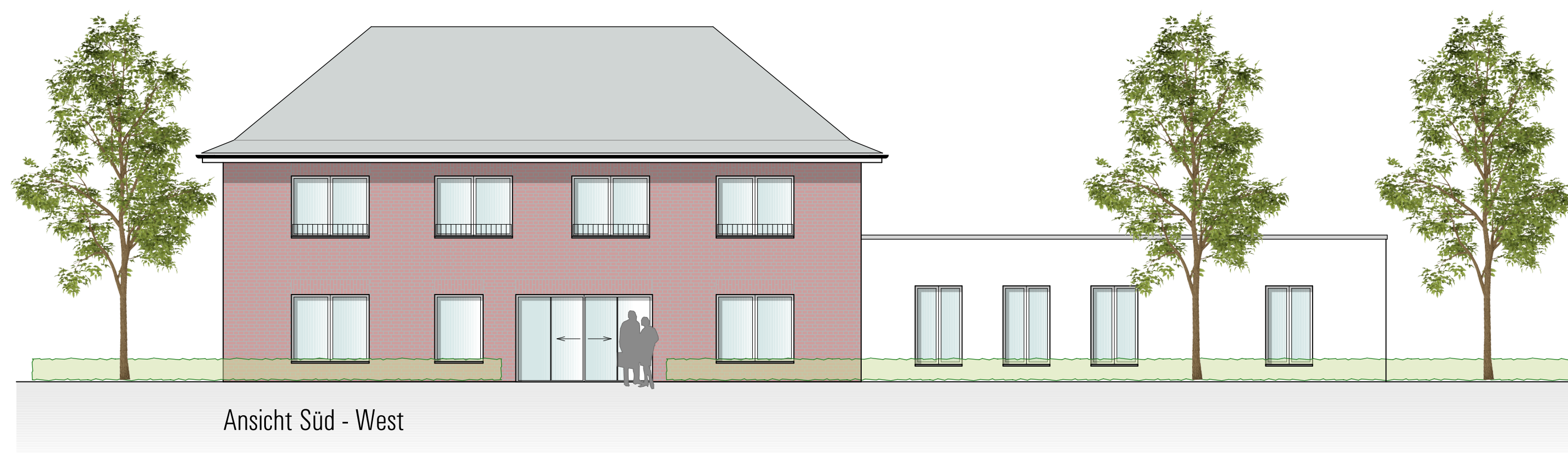
Ansicht Süd - West